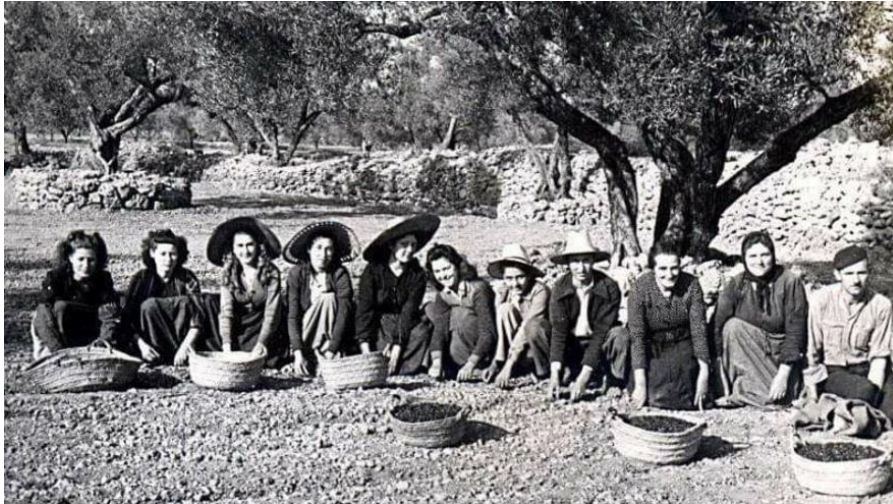
Las 'collidores' de la Serra de Tramuntana. |

eran qué tareas desempeñaban y qué papel jugaron en la construcción del paisaje de la Serra, unas mujeres de los años 50, 60 y 70 que no tenían nada que ver con la imagen bucólica de la payesa mallorquina de las postales», desgrana Ferriol que remarca que el trabajo de campo tiene como claro objetivo recoger la memoria oral de dichas trabajadoras.